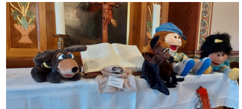
Unsere Living Puppets für den Kindergottesdienst

Auch unser Kindergottesdienst in Groß Brunnsrode hat wieder Fahrt aufgenommen. Es gab eine digitale Schnitzeljagd; einen Clown als besonderen Gast und seit Neuestem haben wir Living Puppets: Das sind große Handpuppen, die den rund 20 Kindern viel Freude bereiten. Auch unser Konfirmandenunterricht findet wieder wie gewohnt statt. Wir sind sogar auf Konfirmandenfahrt gefahren. Das war uns sehr wichtig. Denn wir wollten unbedingt den jungen Menschen diese wichtige Erfahrung mit Kirche wieder ermöglichen.