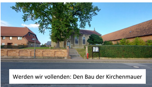
Werden wir vollenden: Den Bau der Kirchenmauer

Was hingegen das Auge sehen kann: Unser Bemühen, die uns anvertrauten Gebäude & Grundstücke zu erhalten und mit Leben zu füllen. Einen Großteil der Kirchwiese haben wir für den Bau eines Spielplatzes freigegeben, damit die Kinder und Familien weiterhin einen solchen Ort im Dorf haben. Für die Zeit nach Corona möchten wir unsere Kirche auch abseits der Gottesdienste mit Leben füllen - mit Kunst und Kultur.