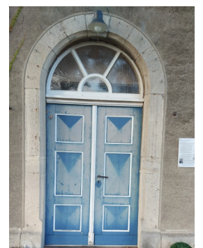
Werden einen neuen Anstrich bekommen: die Türen unserer Kirche

Ihre Spende bleibt zu 100% bei uns und wird direkt wieder vor Ort investiert! Wir sind keine Kirchengemeinde, die Geld hortet.